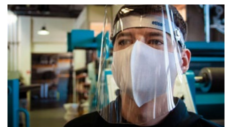
In Lackierereien, Schreinereien, Schleifereien